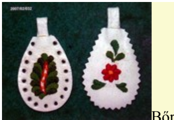
kulcstartó dísz - matyó