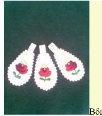
kulcstartó dísz - matyó