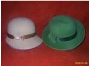
Nyúl szőralpaka kalapok