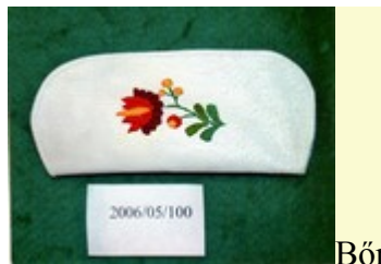
szemüvegtok - matyó