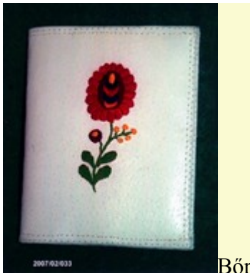
női tárcsa - matyó