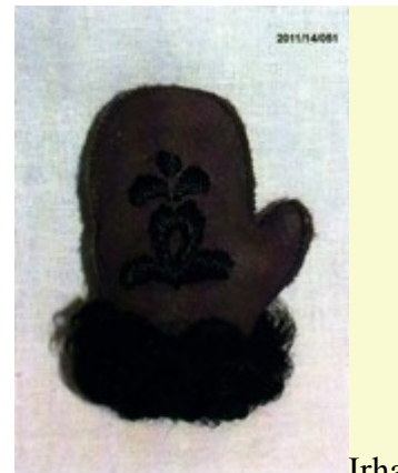
kulcstartó dísz - kunsági