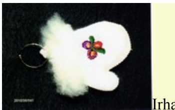
kulcstartó dísz - matyó