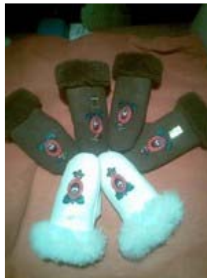
Irhakesztyűk - matyó